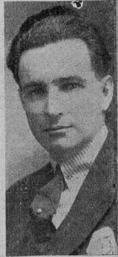
DON TOMAS GUARDIA

su misión de periódico obligado a prestar su franco apoyo a esta institución de carácter nacional, al enviar un caluroso aplauso a la distinguida Asociación, presenta su sincera felicitación a la nueva directiva, integrada por tan significados elementos.